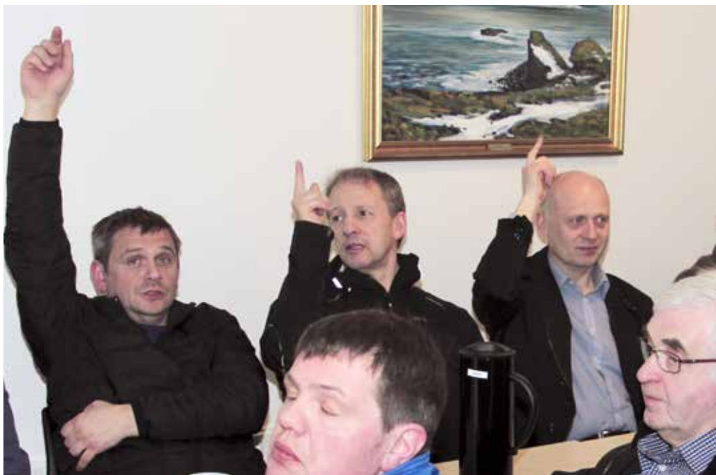
Á aðalfundinum voru fleiri mál, sum atkvøtt varð um.