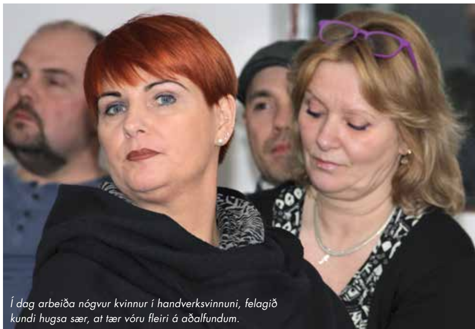
Í dag arbeiða nógvur kvinnur í handverksvinnuni, felagið kundi hugsa sær, at tær vóru fleiri á aðalfundum.

Eitt sum er afturvendandi og sum felagið brúkar nógva orku uppá, er at heinta inn manglandi eftirlønargjald frá arbeiðsgevara. Tað er sum so eisini í ordan, men tað sum ikki er í ordan er hetta, at í fleiri førum hava handverkarar avtalu við meistaran, um at fáa eina hægri løn, ístaðin fyri eftirløn. Tá ið so ósemja uppstendur teirra millum, so hava