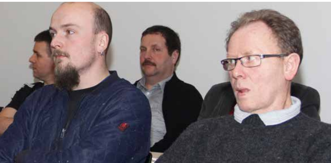
Fundarluttakarar á aðalfundi felagsins 26. mars 2014.05.14.

um okkara eina viðgerðartrygging. Tað vil siga eina trygging móti ymiskum biðilistum.