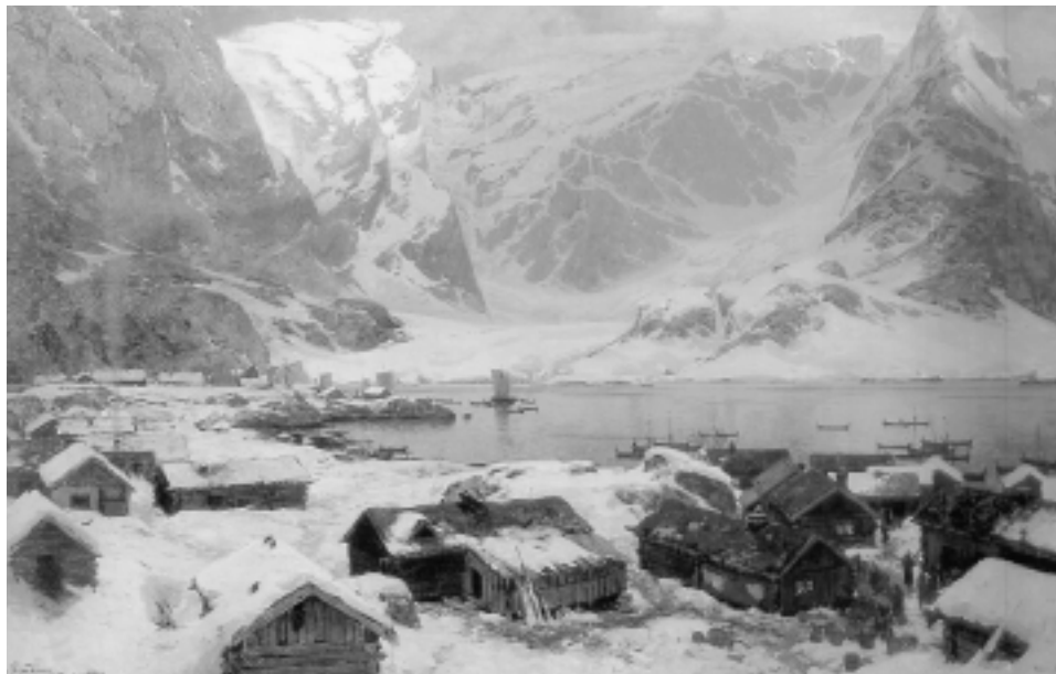
Lofoten í Noregi.

aftaná tíma. Tá það skýmdi hövdu vit enn ekki fingið matartugguna, tí vit voru noyddir at oysa uttan íhald. Og vit voru eins vátir av sveitta, og vit voru av sjógvi. Út á náttina væntaðu vit at hoyra það kenda rópið frá hövuðsmanninum: „Lora toppseglið!“ Men onki kom, og gjøgnum ta longu vetrarnáttina, bóltadu vit avstað undir sama trýsti gjøgnum myrkur og skúm. Oysa, oysa! Har voru ekki stundir at troyttast. Gerst ryggurinn eyður, er bert at dríva á. Verða armarnir lamnir, mugu vit hugsa um það eina aðru ferð. Oysa, oysa.